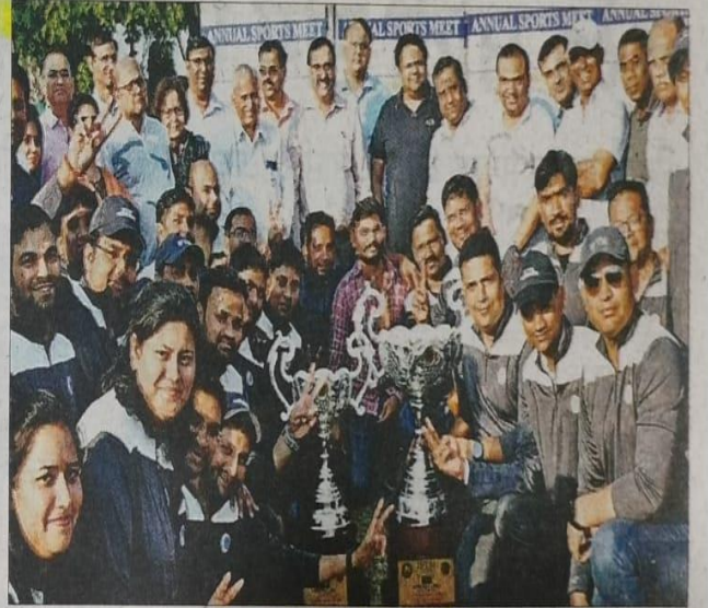
विजेता टीम ट्रॉफी के साथ। विजयि