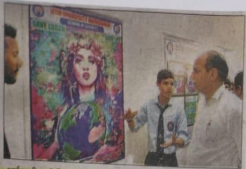
आईएफटीएम में विज्ञान दिवस पर आयोजित हुए कार्यक्रम।