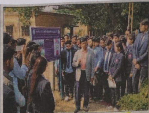
आईएफटीएम के छात्रों ने कृषि उद्योग प्रदर्शनी का भ्रमण किया।