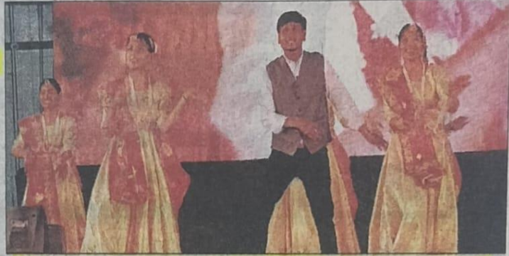
वार्षिक सांस्कृतिक उत्सव कार्यक्रम में प्रस्तुति देते छात्र-छात्राएं।

विद्यार्थियों द्वारा चित्रहार की थीम पर प्रस्तुत किए गए गीत, संगीत और नृत्य की मधुर ध्वनि पर वहां उपस्थित दर्शक झूम उठे। राजीव कोठीवाल ने समावेश 2023 के