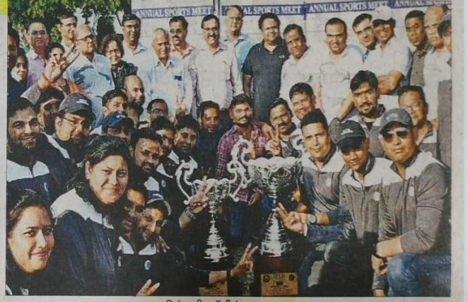
विजेता टीम ट्रॉफी के साथ। विजिति