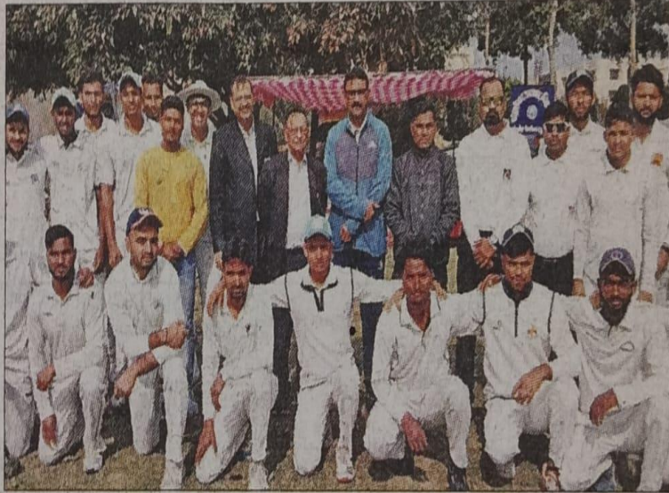
अतिथि के साथ मैच की विजेता टीम के खिलाड़ी। संवाद

लक्ष्य का पीछा करते हुए नागपाल एकेडमी की टीम 32 ओवर में 145 रन बनाकर ऑलआउट हो गई। टीम के लिए