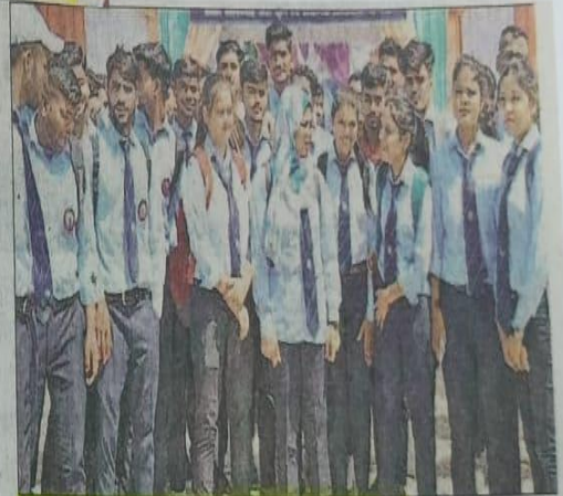
आईएफटीएम के छात्रों ने कृषि प्रदर्शनी का भ्रमण किया।