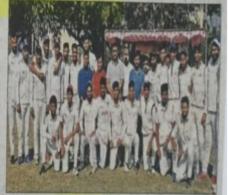
अवस्थी टूर्नामेंट में क्वार्टर फाइनल की विजेता टीम।