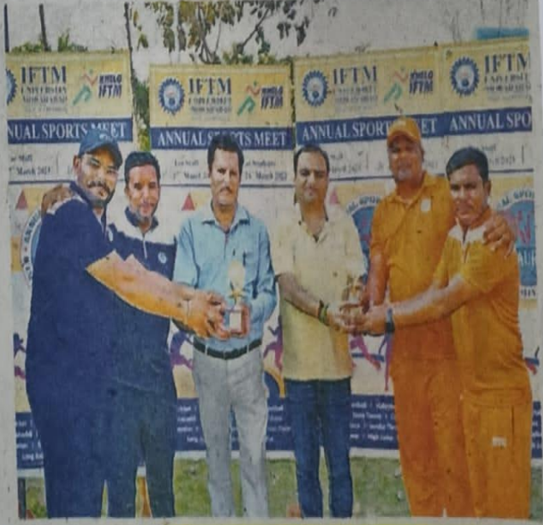
आइएफटीएम विश्वविद्यालय में खेलकूद प्रतियोगिता के दौरान पुरस्कार प्राप्त करते खिलाड़ी