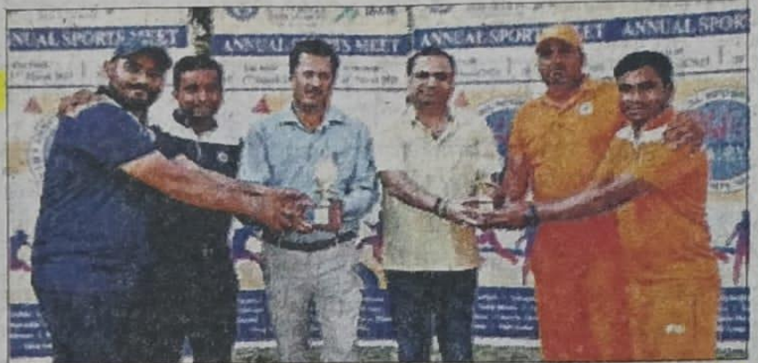
आईएफटीएम में खिलाड़ियों को सम्मानित करते हुए पदाधिकारी। संवाद

वहीं यूनिवर्सिटी पॉलीटेक्निक की टीम ने स्कूल ऑफ इंजीनियरिंग की