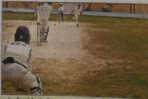
आईएफटीएम में मैच खेलती नागपाल और आर्यन एकेडमी की टीम।