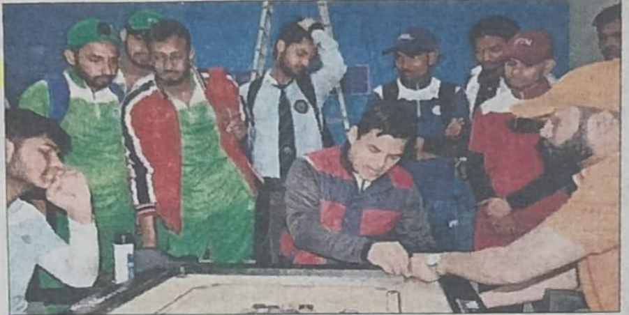
आईएफटीएम विश्वविद्यालय में कैरम खेलते खिलाड़ी। संवाद

वहीं यूनिवर्सिटी पॉलीटेक्निक को रजत तथा स्कूल ऑफ बिजनेस मैनेजमेंट को कांस्य पदक से संतोष करना पड़ा। कैरम के पुरुष वर्ग के सिंगल्स में स्कूल ऑफ बिजनेस मैनेजमेंट ने स्वर्ण, स्कूल ऑफ